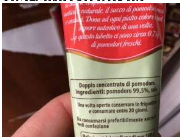
CONCENTRATO DI POMODORO